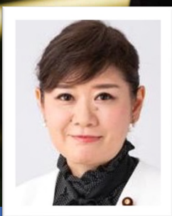
もとむら 伸子 (衆議院議員)