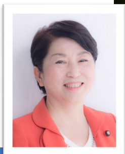
福島 みずほ (参議院議員)