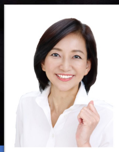
牧山 ひろえ (参議院議員)