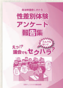
自治体議会における性差別体験アンケート報告集 2015年7月発行 500円