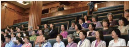
政治分野における 男女共同参画推進 法の成立を求める (2018)