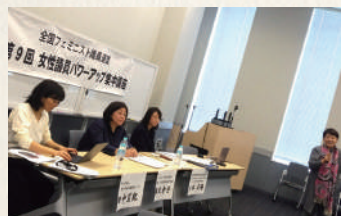
パワーアップ集中講座